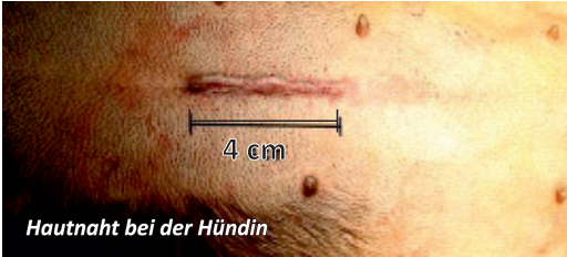
Hautnaht bei der Hündin

Bei der Kastration werden, anders als bei der Sterilisation, die Gonaden (Keimdrüsen) nicht nur abgebunden, sondern chirurgisch vollständig entfernt. Dafür ist eine Vollnarkose notwendig (siehe auch Informationsblatt zur Narkose).