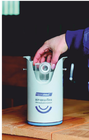
Abb. 3 Nebelkammerdeckel aufsetzen.