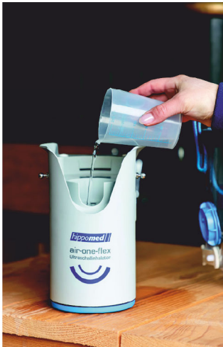
Abb. 1 Kammer 1 mit Kontaktflüssigkeit befüllen.