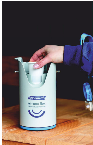
Abb. 2 Kammer 2 (befüllt mit Inhalat) einsetzen.